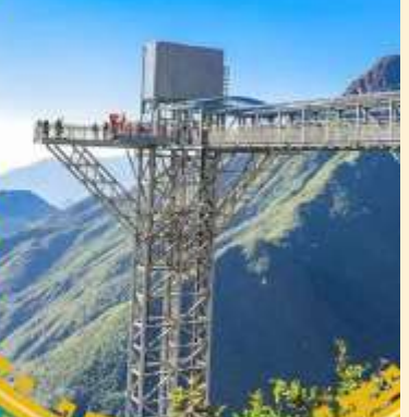
สะพานแก้วมิงกรเมซ