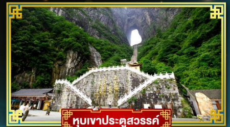
หุบเขาประตูสวรรค์