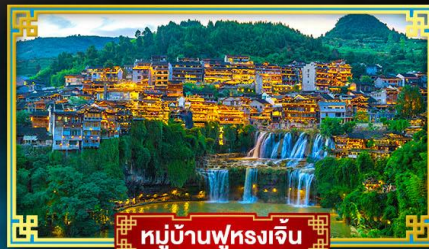
หมู่บ้านฟุรงเจิน