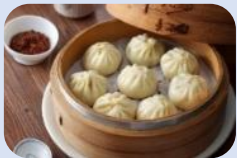
เที่ยง บริการอาหารกลางวัน ณ ภัตตาคาร เมนูพิเศษ!! เสี่ยวหลงเปา (5)

นำท่านนมัสการ วัดหลงซาน (Longshan Temple) เป็นวัดที่เก่าแก่และมีชื่อเสียงของคนไต้หวัน วัดแห่งนี้มีอายุราวๆ เกือบ 300 ปี ด้านหน้าตกแต่งด้วยเสามังกรทั้งชายและขวา เปรียบเสมือนกำลังปกป้องห้องโถงกลาง ในปี ค.ศ. 1740 เกิดความเสียหายครั้งใหญ่ทางวัดจึงได้รับการบูรณะหลายครั้ง ทั้งบานประตู คาน หลังคา และเสามังกรแกะสลักตระหง่านสวยงาม เป็นประติมากรรมที่มีความละเอียดอ่อนเป็นงานไม้ที่สวยงาม มีหนังสือจินโบราณประดับตรงทางเข้าให้ความสัมผัสของวรรณกรรมนอกเหนือจากคุณค่าทางศรียังส่งเสริมการท่องเที่ยวอีกด้วย ปัจจุบันเป็นที่นิยมมาขอพรเรื่องการทำงาน การเรียน ที่สำคัญเรื่องความรัก เชื่อกันว่าใครที่ไม่ประสบความสำเร็จเรื่องความรัก ให้ขอพรกับเทพเจ้าจันทราที่วัดแห่งนี้ แล้วความรักจะกลับมาดีขึ้น