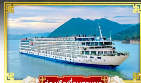
ล่องเรือเขื่อนสามผา