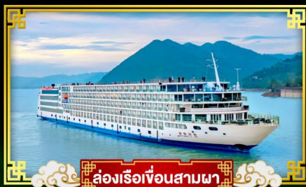
ล่องเรือเขื่อนสามผา