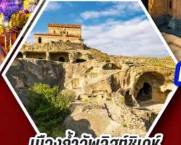
เมืองด้าอพลิสตีเคห์

พัก Rooms Hotel โรงแรมวิวหลักล้านของเทือกเขาคอเคซัส