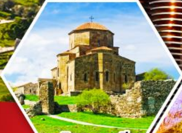
วิหารจาวารี