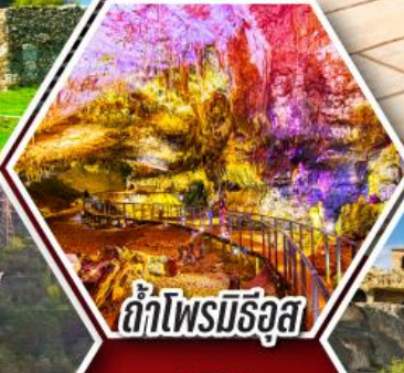
ด้าไฟรมีริอูล