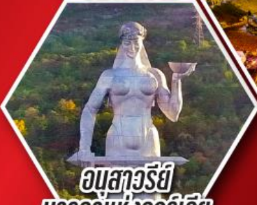
อนุสาวรีย์