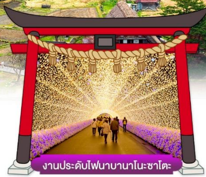
งานประดับไฟนาบานาโนะซาโตะ