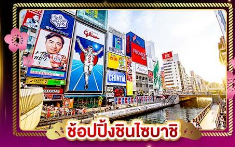
ช้อปปิ้งชินไซบาชิ