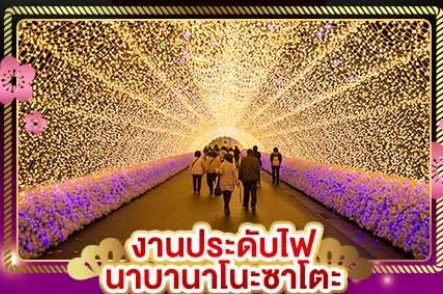
งานประดับไฟ นาคานาโนะซาโตะ