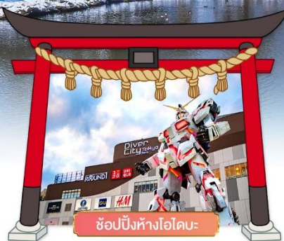
ช้อปปิ้งห้างไอโดบะ