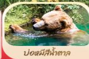
ปอแตมีสีน้ำตาค