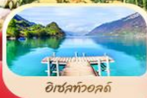
อิชลทัวอลด์