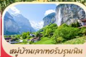
หมู่บ้านเลาทอร์บรุนเนิน