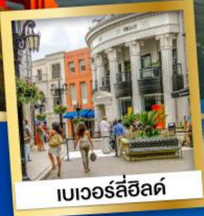
เบเวอร์ลี่ฮิลล์