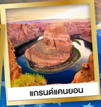
แกรนด์แคนยอน