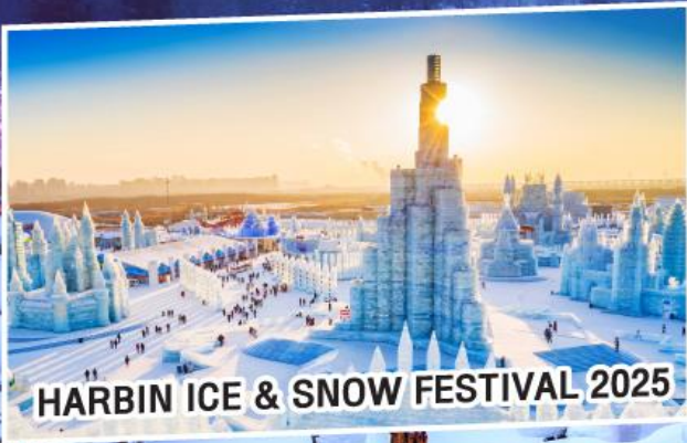
HARBIN ICE & SNOW FESTIVAL 2025