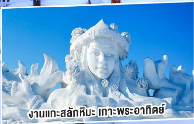
งานแกะสลักหิมะ เกาะพระอาทิตย์