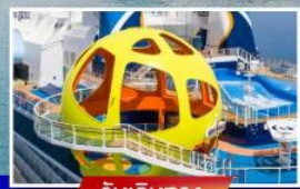
วันเดินทาง