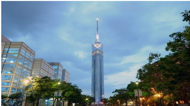
Fukuoka Tower หอคอยติดทะเลที่สูงที่สุดในประเทศญี่ปุ่นถึง 234 เมตร

ท่านสามารถลงไปเที่ยวอิสระตามอัธยาศัย หรือ ซื้อทัวร์เสริมของเรือที่ให้บริการอยู่ได้ ควรซื้อทัวร์ เสริมของทางเรือก่อนจะถึงจุดหมายที่ท่านต้องการ 1 วันเดินทาง