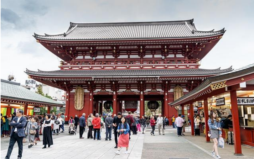
วัดเซ็นโซจิ อาซากุสะ

ท่านสามารถลงไปเที่ยวอิสระตามอัธยาศัย หรือ ซื้อทัวร์เสริมของเรือที่ให้บริการอยู่ได้ ควรซื้อทัวร์เสริมของทางเรือก่อนจะถึงจุดหมายที่ท่านต้องการ 1 วันเดินทาง