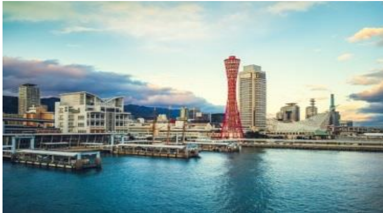
โทเททาวเวอร์ / Kobe Port Tower

สถานที่ท่องเที่ยวที่ได้รับความนิยมมากที่สุดในโกเบ: