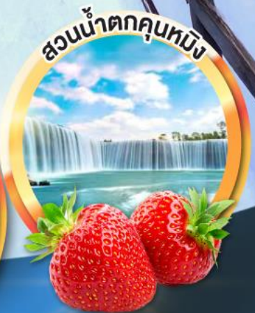
สวนน้ำตกคุณหมิง