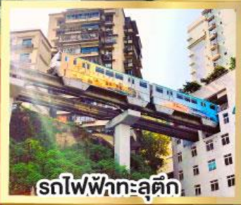
รถไฟฟ้ากะลุดัก