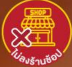
ไม่ลงร้านช้อปปิ้ง