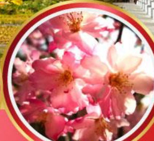
สวนหยวนทง