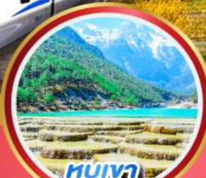
หุบเขา พระจันทร์สีน้ำเงิน