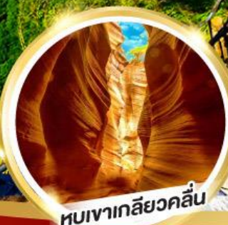
หุบเขาเกลียวคลื่น