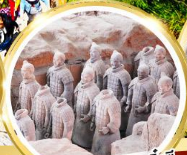
กองทัพทหารดินเผาจีนซี