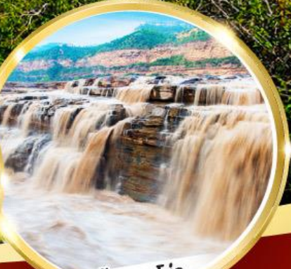
น้ำตกหูโจว