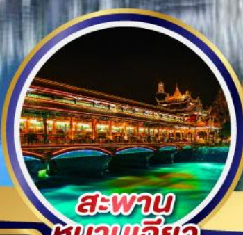
สะพาน หนานเจียว