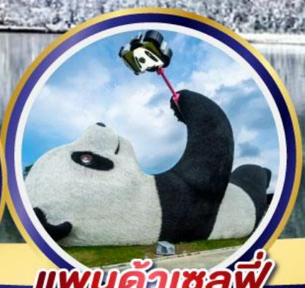
แพนด้าเซลฟี