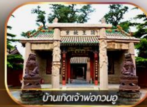
บ้านเกิดเจ้าฟักทวนอู