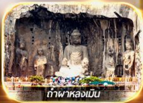
ถ้ำพลาหลงเมิน