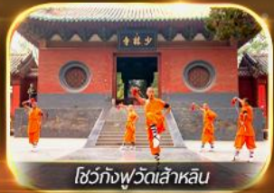
โชว์กังฟูวัดเส้าหลิน

เที่ยวนครซีอาน อุทยานสวรรค์หยุนโกซาน ย้อนรอยอดีตกองทัพสุดยิ่งใหญ่ " สุสานทหารดินเผาจีน " และถ้ำพลาหลงเหมินงานแกะสลักหินฟา ชมโชว์กังฟูวัดเส้าหลิน