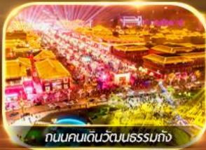
ถนนคนเดินวัฒนธรรมกั๋ง