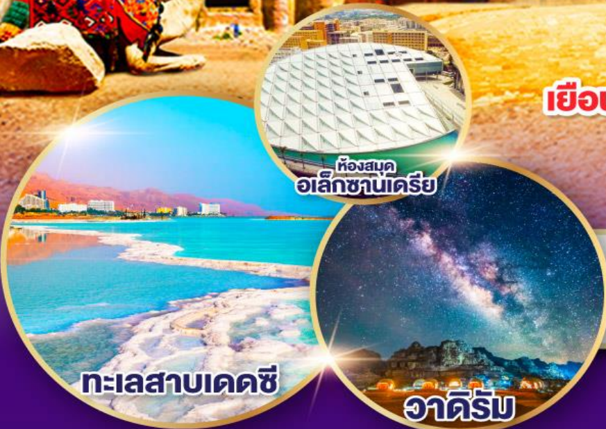
ห้องสมุด อเล็กซานเดรีย

เยือนมหาพีระมิดที่ซาและนครรัฐเพตรา 2 สิ่งมหัศจรรย์ที่สุดของโลก