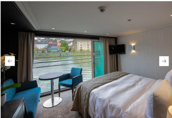
Image is from the Avalon Envision, a sister suite ship. Actual layout may vary slightly. Please refer to the Photo Gallery below for suite images.