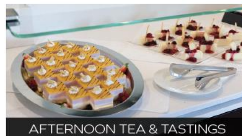
AFTERNOON TEA & TASTINGS

The Club Lounge offers specialty coffees around the clock, as well as a range of teas and cookies - all complimentary! (Also available in the Panorama Lounge).