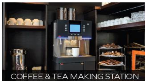
COFFEE & TEA MAKING STATION

Enjoy a drink with newfound friends - serving premium spirits, wines, beers and cocktails at reduced prices. Why not try a cocktail from the extensive Active & Discovery SM -inspired bar menu?