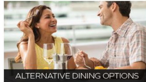
ALTERNATIVE DINING OPTIONS

Red, white, rosé and regional wines as well as local beers are served throughout lunch & dinner, sparkling wine is available with breakfast, and complimentary soft drinks are available with all meals on board, as well as tea & coffee 24/7.