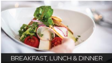
BREAKFAST, LUNCH & DINNER

On an Avalon river cruise, great food is all part of the journey with all meals on board included. Our talented chefs use the freshest local ingredients to create inspired menus that incorporate the perfect balance of regional flavour and worldly flair, served in your choice of venues on board.