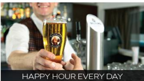
HAPPY HOUR EVERY DAY

Whether you're in the mood for an elegant four-course dinner in the glass-walled Panorama Dining Room, evening tapas in the cosy Panorama Bistro, a breezy al fresco lunch at the Sky Grill, breakfast in bed or a packed picnic basket to-go, you can choose the menu and venue that work for you.