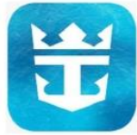
Royal Caribbean International App.