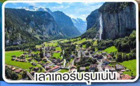
ทะเลสาบรุสเซน