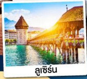
ลูซิิร์น

ณ เมืองลูคอร์เนค เมืองแห่งน้ำแร่สวิตเซอร์แลนด์