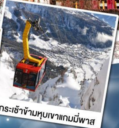
กระเช้าข้ามหุบเขาแกมมีพาส

18-24 ก.พ. 68 11-17 มี.ค. 68 02-08 เม.ย. 68 29 เม.ย.-05 พ.ค. 68