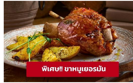
พิเศษ!! ขาหมูเยอรมัน

นำท่านเที่ยวชม เมืองฟูสเซน (Fussen) ขึ้นชื่อเรื่องความสวยงามของตัวตึก รามบ้านช่องเพราะทั้งเมืองจะมีหลากสีสันเหมือนกับลูกกวาดสีสวยๆ ทั้ง เมืองจนได้รับสมญานามว่า City of candy นำท่านเดินทางสู่ เมืองเคมป์เทิน (Kempten) (ระยะทาง 46 กม./ 1 ชั่วโมง) เป็นชุมชนเมืองที่เก่าแก่ที่สุดใน เยอรมนี ให้ท่านถ่ายรูปบริเวณด้านนอก มหาวิหารเซนต์ลอว์เรนซ์ แอชวิลล์ (Basilica of Saint Lawrence) สร้างเสร็จในปี 1909 และเป็นหนึ่งในสมบัติ ทางสถาปัตยกรรมและจุดยึดทางจิตวิญญาณของแอชวิลล์