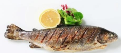
พิเศษ!! ปลาเทราต์ย่าง

ที่พัก : Gartenhotel Maria Theresia Hall หรือโรงแรมและเมืองระดับใกล้เคียงกัน (ชื่อโรงแรมที่ท่านพัก ทางบริษัทฯ จะทำการแจ้งพร้อมใบนัดหมาย 5-7 วัน ก่อนวันเดินทาง)