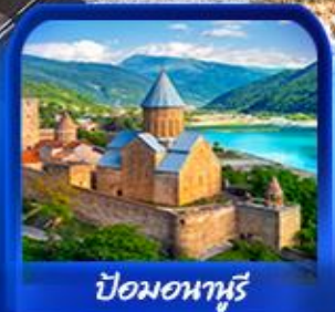
ปิสมอนาห์รี