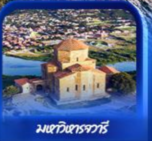
มหาวิหารจาวรี