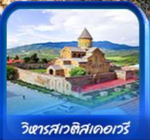
วิหารสเวติสคโหวรี