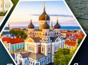
วิหารอเล็กซานเดอร์เนฟสกี (ทาลลินน์)