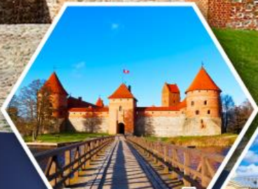
ปราสาททราโต