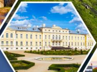
พระราชวังรินดาเล