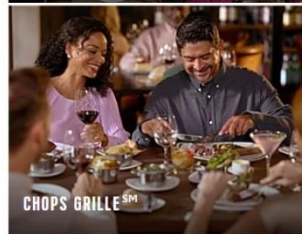
CHOPS GRILLE SM