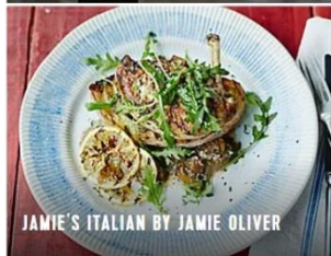
JAMIE'S ITALIAN BY JAMIE OLIVER