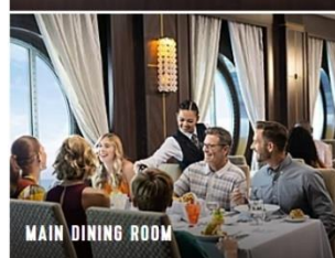
MAIN DINING ROOM