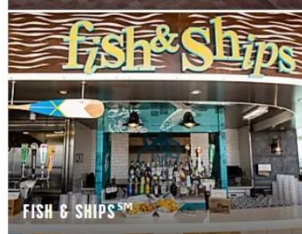
FISH & SHIPS SM