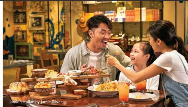
Jamie's Italian by Jamie Oliver