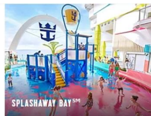
SPLASHAWAY BAY SM