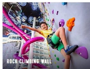
ROCK CLIMBING WALL