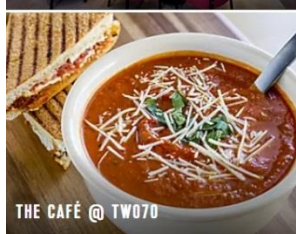
THE CAFE @ TW070