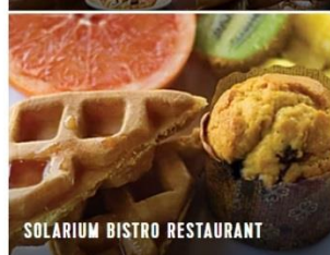
SOLARIUM BISTRO RESTAURANT