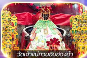
วัดเจ้าแม่กวนอิมของฮำ