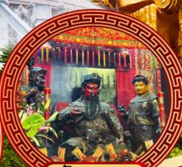
วัดกวนอู