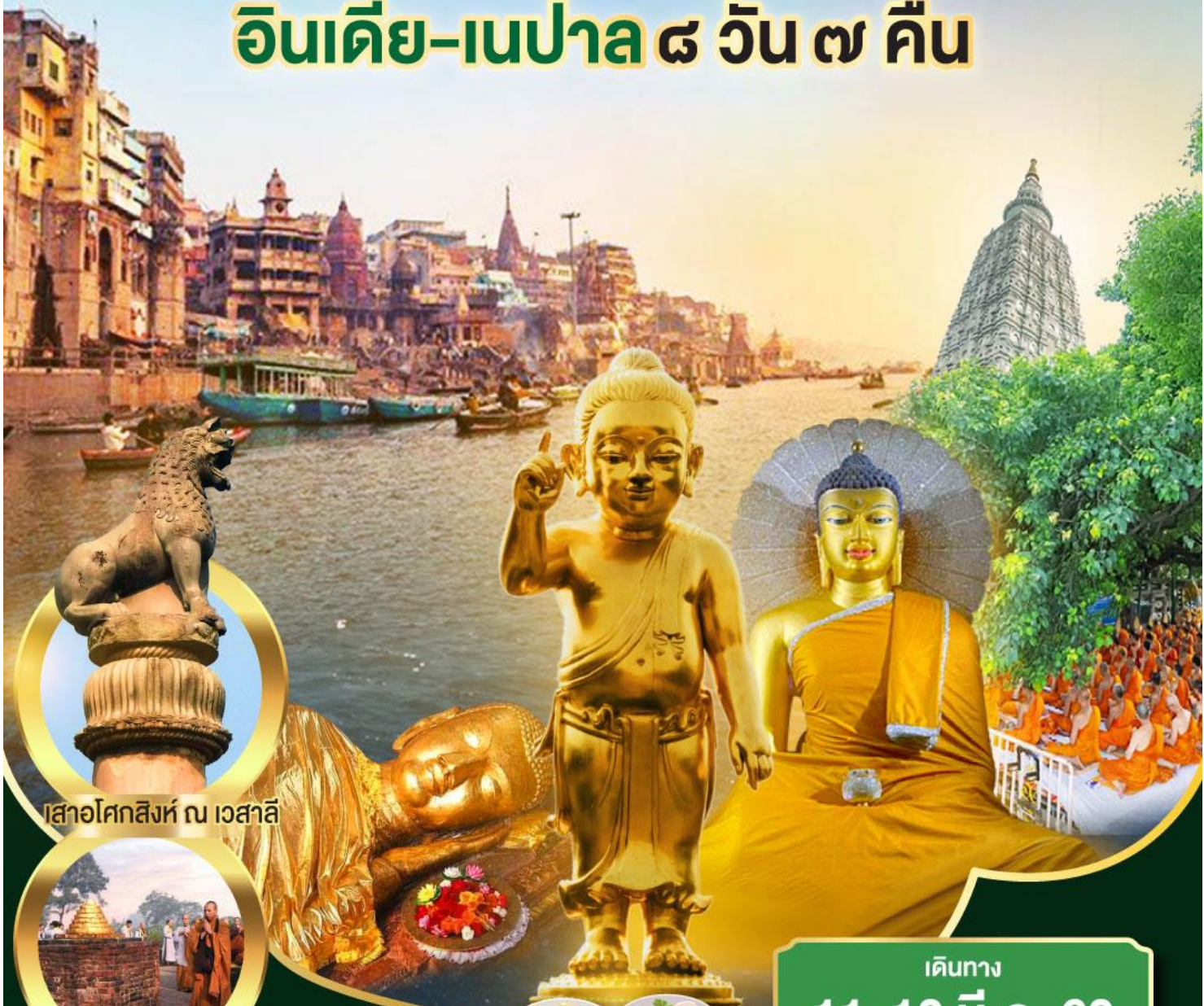
เสาอโศกสิงห์ ณ เวสาลี