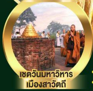
เขตนิมิตตวิหาร เมืองสาวัตถี