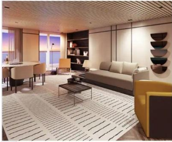
The Haven Premier Owner's Suite with Large Balcony