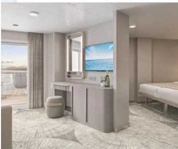
Forward Facing Suite with Large Balcony