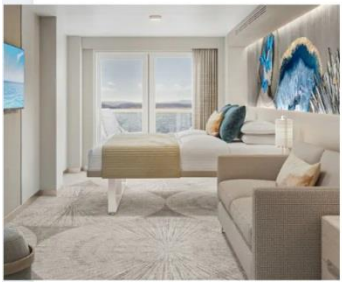
Club Balcony Suite