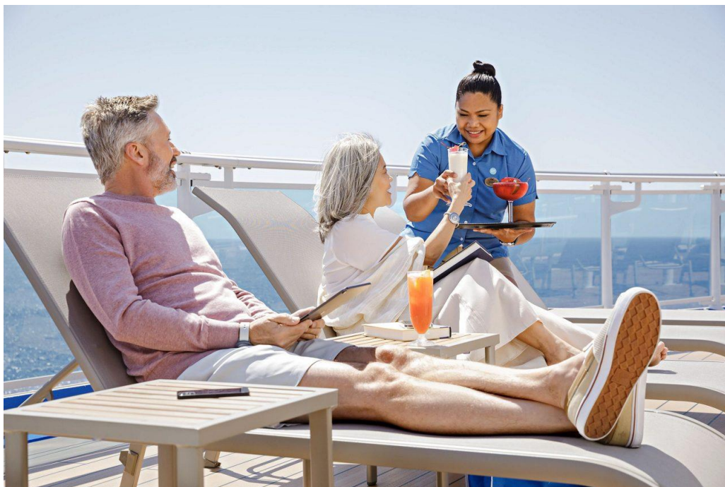
อาหารกลางวัน และอาหารค่ำ บนเรือสำราญ ไดมอนด์ปรินเซส พักค้างคืนบนเรือสำราญ DIAMOND PRINCESS