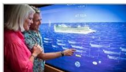
Events On Board