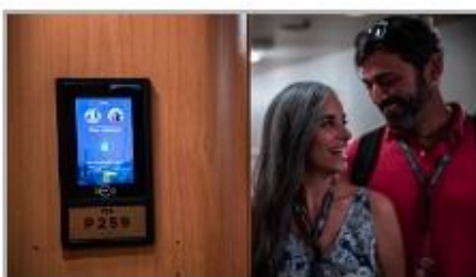
Keyless Stateroom Entry