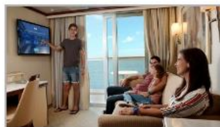
Simplified Safety Training