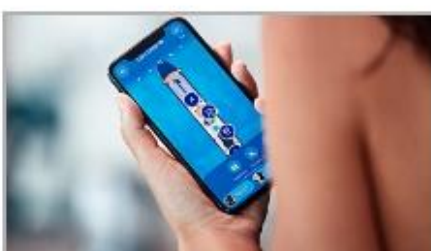
Find Your Way & Your Friends