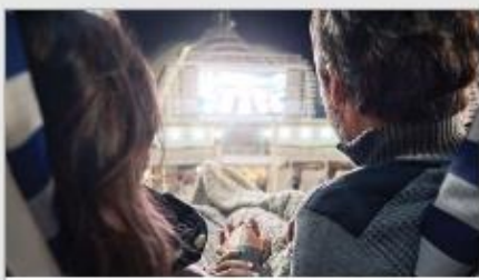
Movies Under the Stars ®

Original musicals, dazzling magic shows, feature films, top comedians and nightclubs that get your feet movin' and groovin'. There's something happening around every corner; luckily, you have a whole cruise of days and nights to experience it all. 1