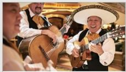
Music & Dancing