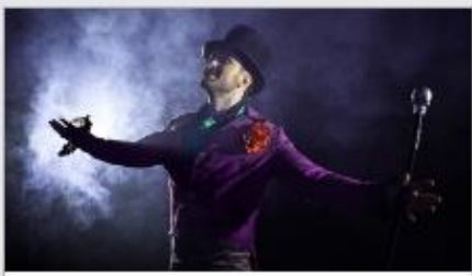
Featured Guest Entertainers