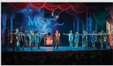
Original Musical Productions