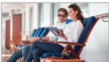
The Best Wi-Fi at Sea