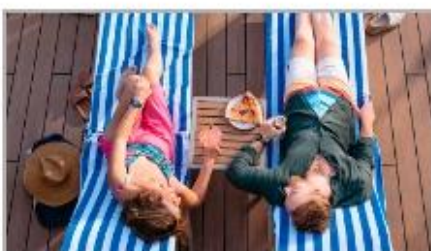
Whatever You Need, Delivered