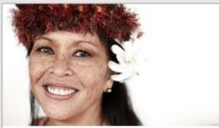
Festivals of the World