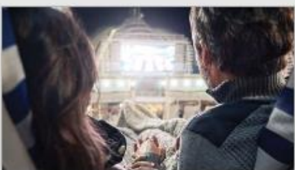
Movies Under the Stars®

Original musicals, dazzling magic shows, feature films, top comedians and nightclubs that get your feet movin' and groovin'. There's something happening around every corner; luckily, you have a whole cruise of days and nights to experience it all. 1