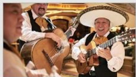
Music & Dancing