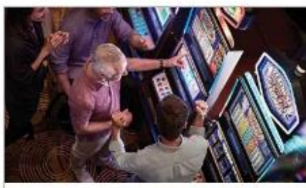
Vegas Style Casino