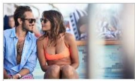
Freshwater Pools & Hot Tubs