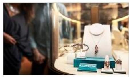
The Shops of Princess