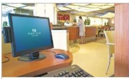
Internet Café & Library