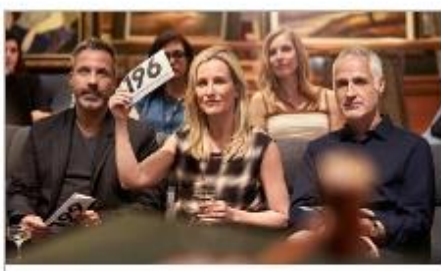
Art Gallery & Auctions