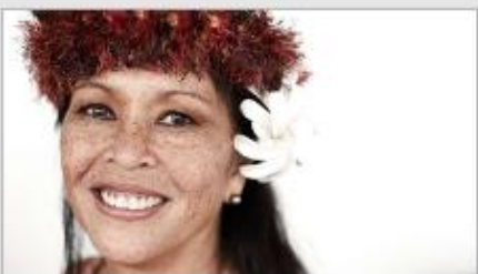
Festivals of the World