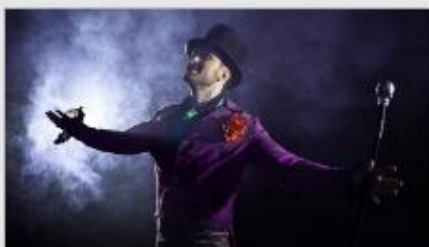
Featured Guest Entertainers