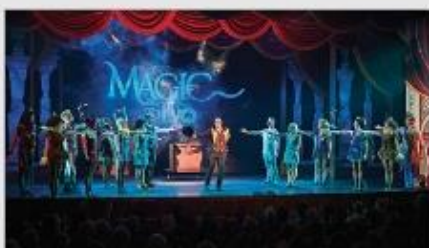
Original Musical Productions