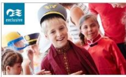
Discovery at SEA Programs

On every Princess ship, you'll find so many ways to play, day or night. Explore The Shops of Princess, celebrate cultures at our Festivals of the World or learn a new talent — our onboard activities will keep you engaged every moment of your cruise vacation.†