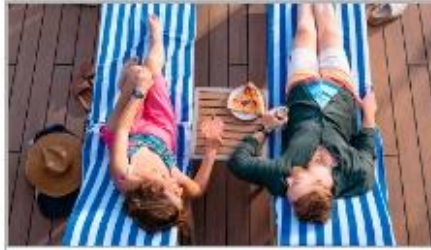
Whatever You Need, Delivered