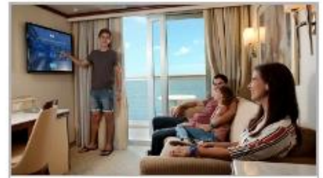
Simplified Safety Training