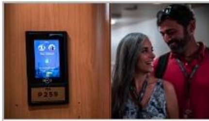
Keyless Stateroom Entry