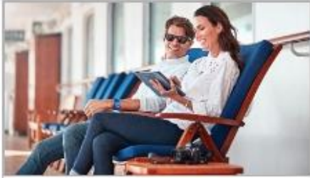
The Best Wi-Fi at Sea