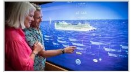
Events On Board