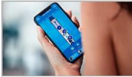
Find Your Way & Your Friends