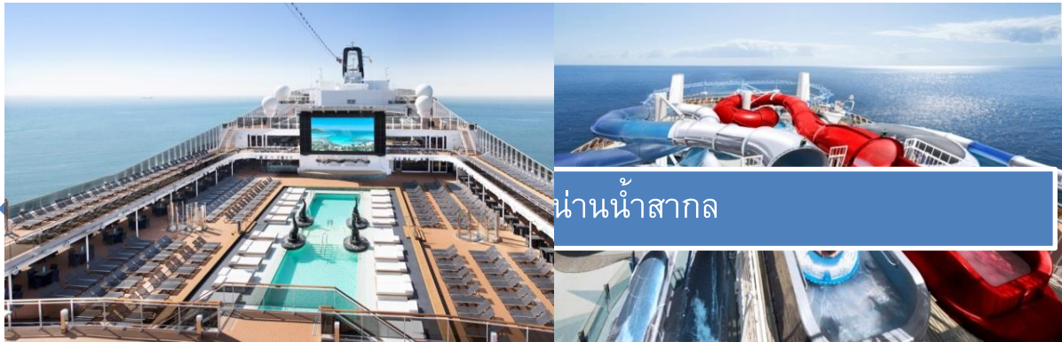
น่านน้ำสากล