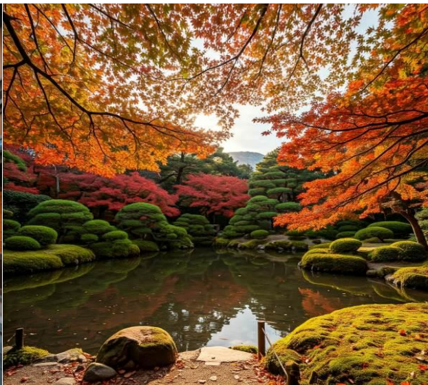
สวนเคนโรคุเอ็น

ท่านสามารถเลือกท่องเที่ยวอิสระได้ด้วยตัวเอง หรือซื้อทัวร์เสริมบนฝั่งกับทางเรือล่วงหน้า จะ