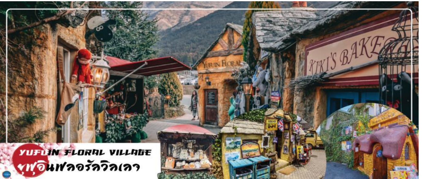
YUFUIN FLORAL VILLAGE หมู่บ้านฟลอรัลวิลเลจ