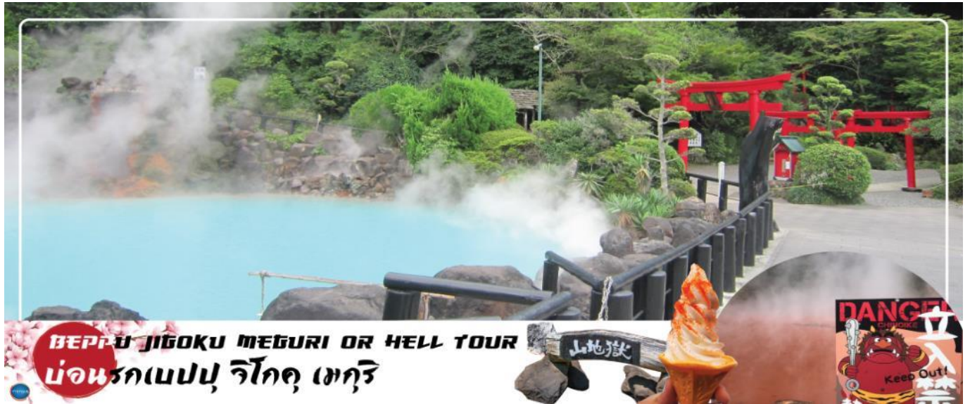
BEPPU JIGOKU MEGURI OR HELL TOUR บ่อนรกเบปปุ จิโกคุ เมกุริ