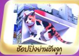
ช้อปปิ้งย่านชินจูกุ

เดินทาง 20-25 มี.ค. 68 8-13 พ.ค. 68 29 พ.ค. - 3 มิ.ย. 68 19-24 มิ.ย. 68