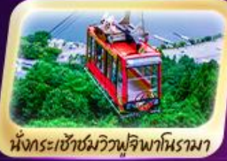
นั่งกระเช้าชมวิวนิฟูจิพาโนรามา