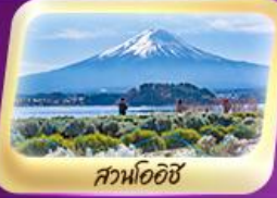
สวนโออิชิ