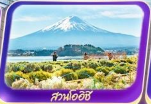
สวนโออิชิ