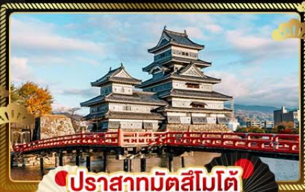
ปราสาทมัตสึโมโต้