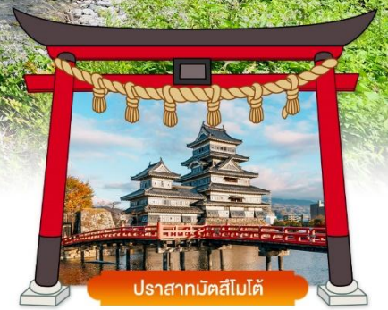
ปราสาทมัตสึโมโด้