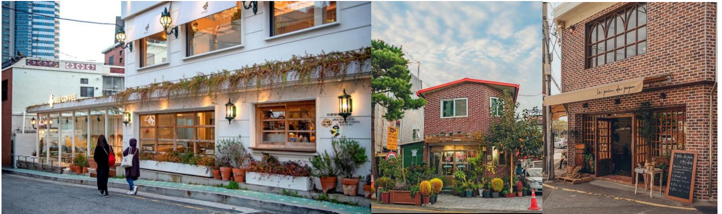
สำหรับคนหนุ่มสาวและเป็นสถานที่ท่องเที่ยวในชวอนที่ห้ามพลาด

อิสระให้ท่านเดินเล่นที่ แฮนกริดัน-กิล (Haengridan-gil) คล้ายกับคยองรีตัน-กิล ในกรุงโซล เป็นสถานที่ที่มีร้านอาหารและร้านกาแฟที่มีเอกลักษณ์เฉพาะตัว รวมระยะทาง 612 เมตร จากสวนฮวาซอถึงประตูฮวาซงมุนในฮวาซงชวอน Haenggung-dong และ Gyeongnidan-gil ถูกรวมเข้าด้วยกันเพื่อเรียกว่า Haengridan-gil บริเวณพระราชวังฮวาซงแองกุงถูกกำหนดให้เป็นเขตพัฒนาแบบจำกัด และเป็นพื้นที่ที่มีบ้านเก่าและฮันอกจำนวนมาก ด้วยการปรับปรุงอาคารเก่า ร้านกาแฟ ร้านอาหาร และร้านค้าที่ได้รับเลือกจึงมีรสนิยมและเป็นเอกลักษณ์ ทำให้ที่นี่กลายเป็นถนนตัวแทน