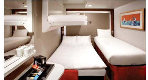
พัก 3-4 ท่าน