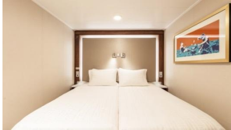
พัก 1-2 ท่าน

From 13 - 14 sq.m Max Occupancy 2-4^ Deck 5/8/9/10/11/12/13/15 2 Single Beds / 2 Single beds + 1 Ceiling Pullman Bed / 1 Single Bed + 1 Pullman Bed + 1 Double Sofa Bed