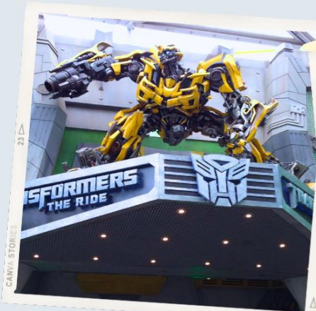
ZONE 1 : HOLLYWOOD