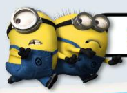
ZONE 5 : THE LOST WORLD