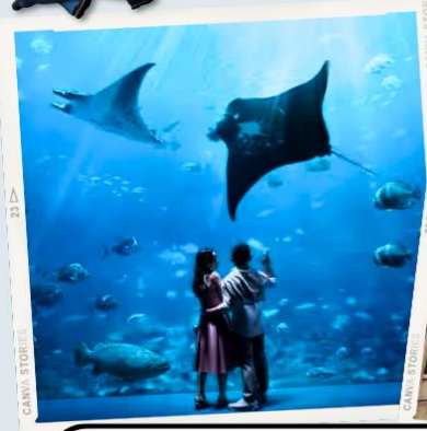
ZONE 7 : FAR FAR AWAY