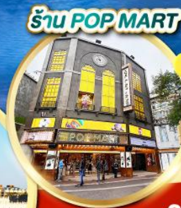
ร้าน POP MART