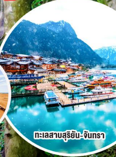
ทะเลสาบสุริยัน-จันทรา