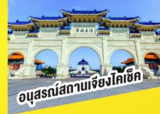
อนุสรณ์สถานเจียงโตเซ็ก