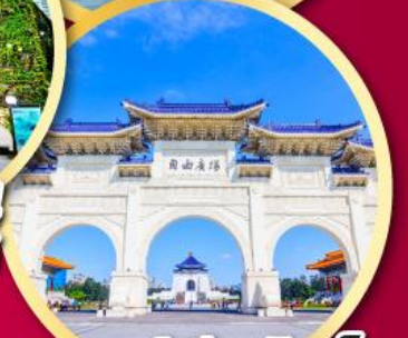
อนุสรณ์เจียงไคเช็ค