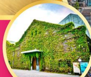
Huashan 1914 Creative Park