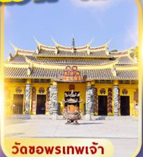
วัดชอพรเทพเจ้า