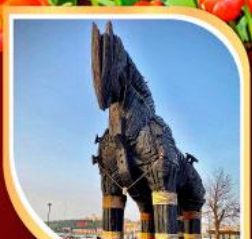
น้ำไม้แห่งทรอย