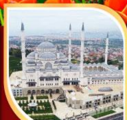
มัสยิดคัมลิก้า